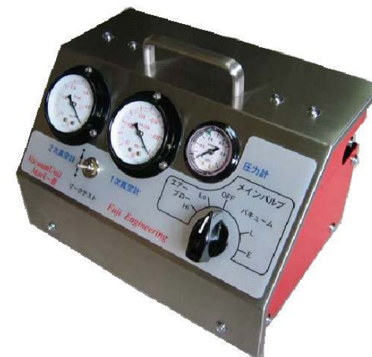
Type-M (M・D・F のデザインは同じです)